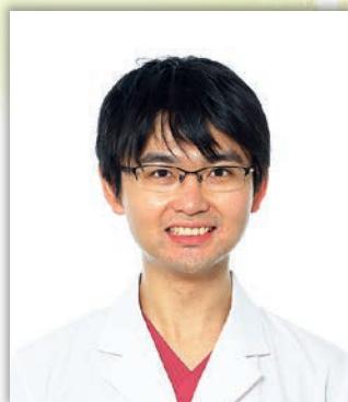
高知赤十字病院 内科医師