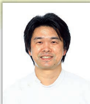
高知赤十字病院 第二外科副部長